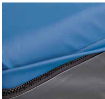
Cierre con solapa protectora