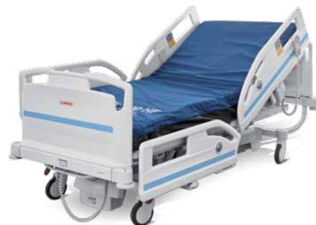
Colchón sin SCU