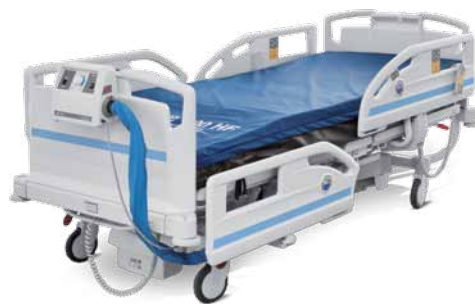
Colchón con SCU