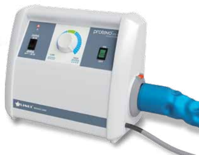
Unidad de control del sistema (SCU) de Clinicare HF