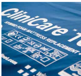
Funda superior elástica en cuatro direcciones