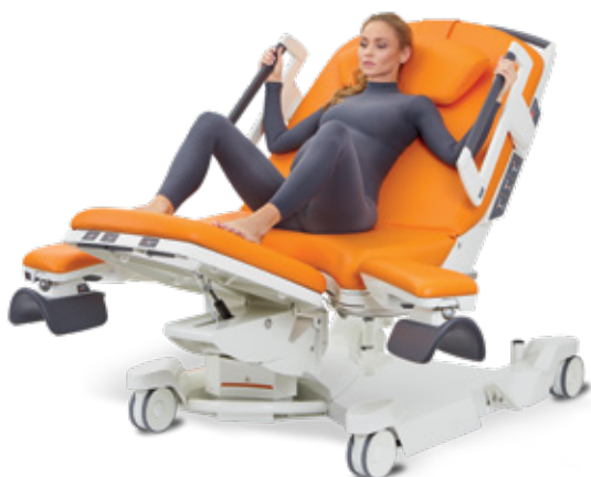
V pololeže v náklonu s chodidly opřenými o podnožní díl