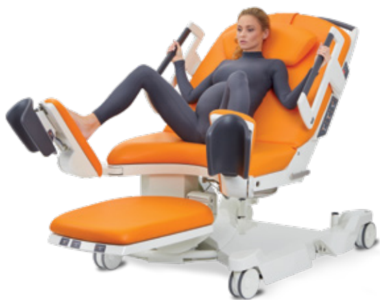
V pololeže v náklonu s chodidly opřenými o nožní podpěry