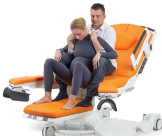
V polosedě s asistencí partnera