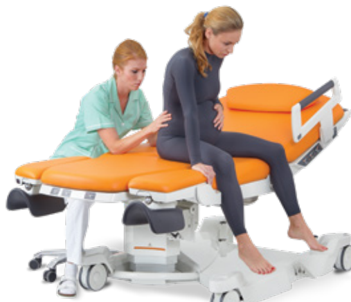
Aplikace epidurální anestezie