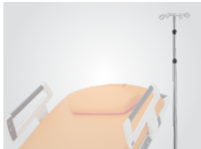
Teleskopický infuzní stojan