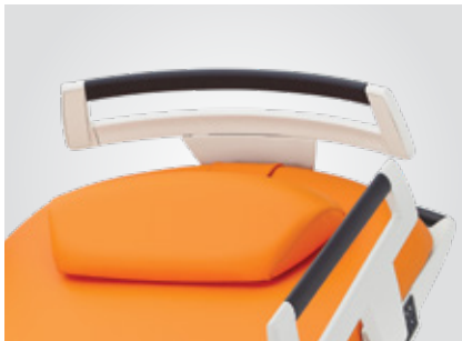
Odnímatelné čelo lůžka