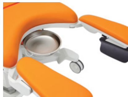
Výsuvná nerezová miska 4,5 l