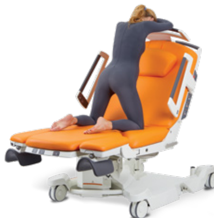
Ve vzpřímené poloze