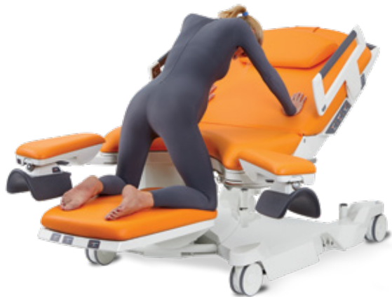
V poloze na všech čtyřech