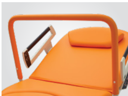
Podpurná čalouněná hrazda