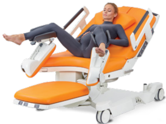
V pololeže v náklonu s podepřením nohou