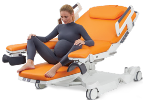
V polosedě s využitím podnožního dílu