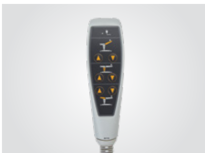
Ruční dálkový ovladač