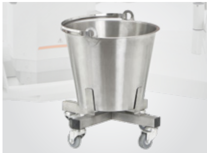
Nerezová miska s kolečky