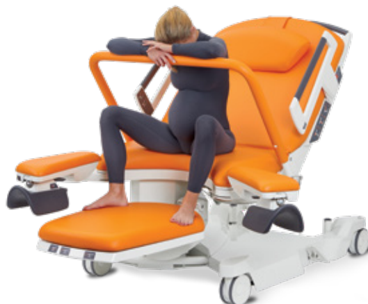
V sedě s využitím hrazdy