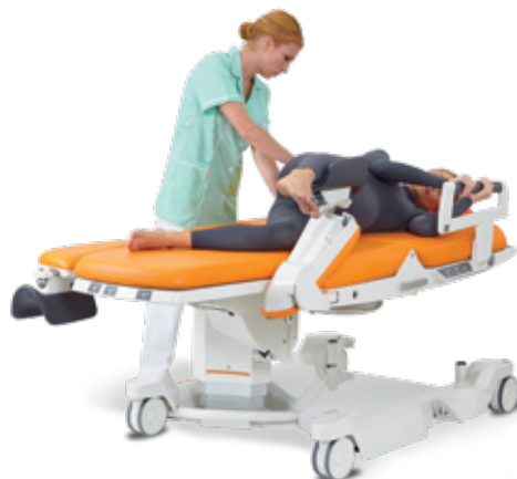
V leže na boku