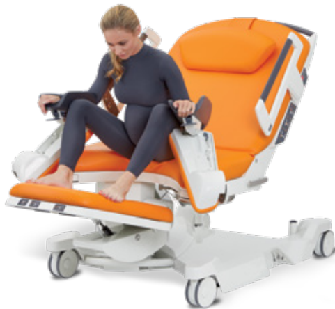
V polosedě s využitím nožních podpěr