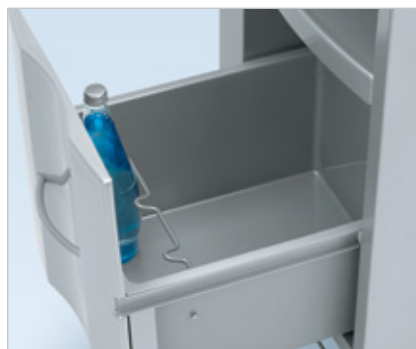
Spodní velká zásuvka je vybavena praktickým držákem lahví.