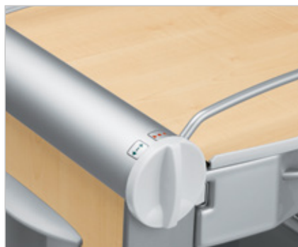
Pootočením ručního ovládání lze stolek zabrzdit či odbrzdit.