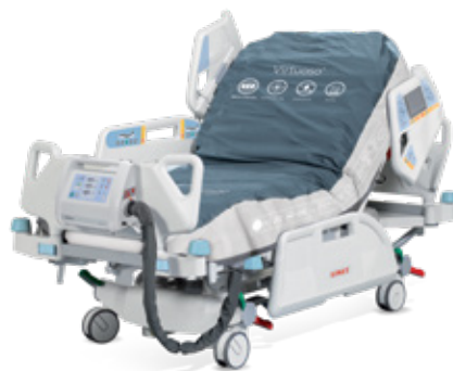
Virtuoso s nulovým tlakem a technologií 3 cel.

Konstrukce lůžka Multicare umožňuje použít různé matracové systémy k prevenci vzniku dekubitů podle potřeb pacienta.