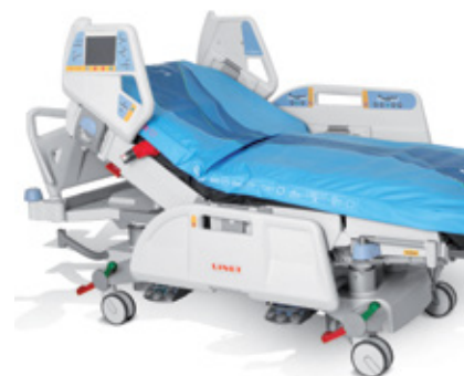
Integrovaný systém OptiCare.