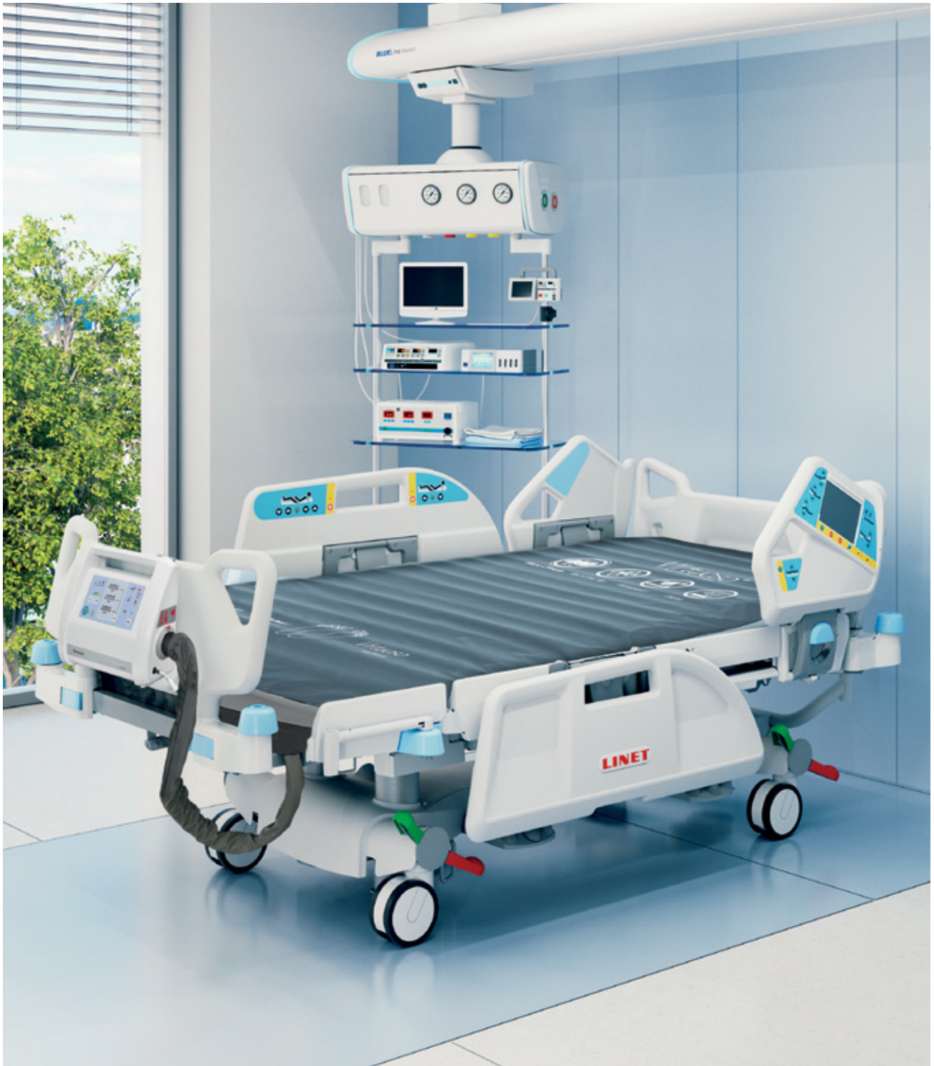
Lůžko pro intenzivní péči